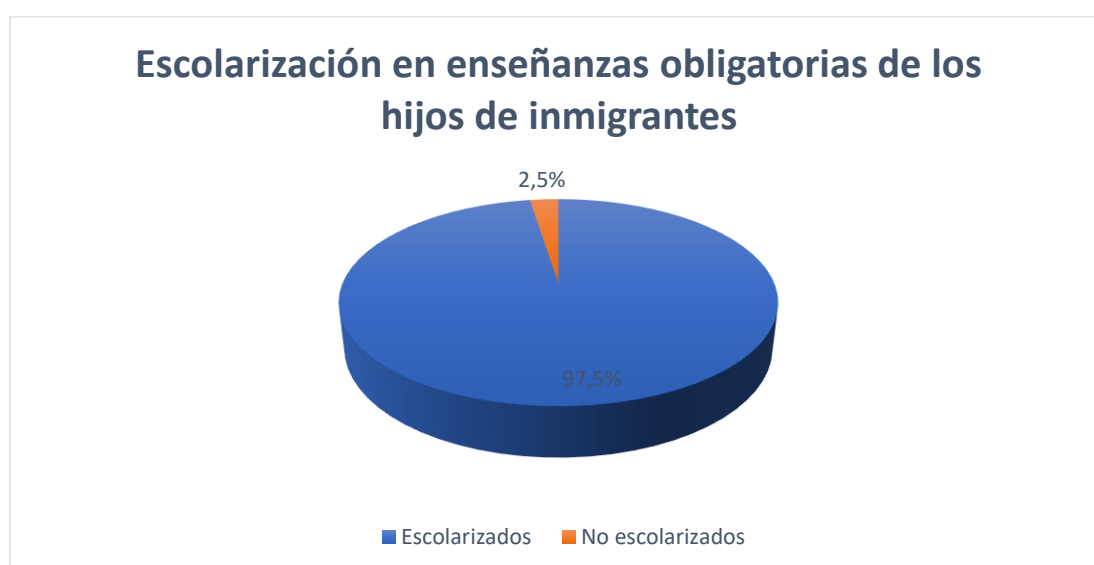
Imagen 1. Escolarización en enseñanzas obligatorias.