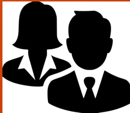
Agents de la JA