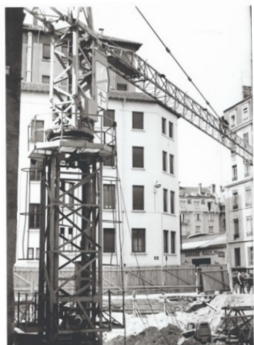
Construction de la MOM

La création de la MOM en 1975 par Jean Pouilloux était issue de sa volonté de rassembler en un même lieu les équipes lyonnaises qui travaillaient sur l'Antiquité