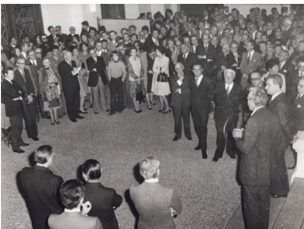
Inauguration de la MOM le 27 octobre 1975