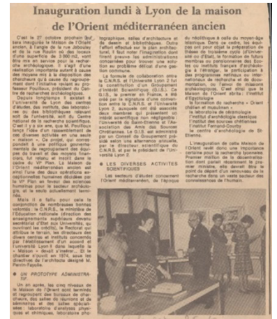
Article Le Progrès du 25 octobre 1975

Cet article du journal Le Progrès du 25 octobre 1975 intitulé « Inauguration lundi à Lyon de la maison de l'Orient méditerranéen ancien » nous rappelle la genèse de ce projet. Il souligne le caractère unique de son statut (le premier groupement d'intérêt scientifique) en utilisant l'expression « prototype administratif » pour le qualifier et détaille ses activités scientifiques (secteurs d'études, objectifs et instituts fondateurs).