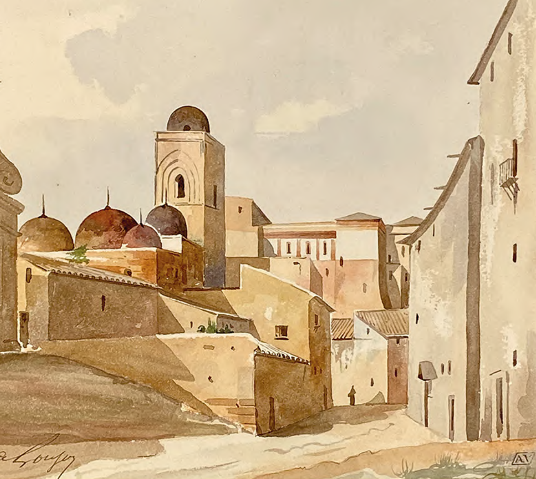
Adolphe Goujon, San Giovanni degli Eremiti de Palermo, 1832