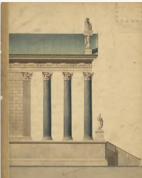
Henri Labrouste, Envoi de Rome première année, 1825

La collection de dessins de l'AA, étroitement liée à ce système, abrite un nombre important d'Envois de Rome. Parmi eux, les envois de 4e année de Sainte-Sophie à Constantinople par H. Prost (1907) et de l'Acropole d'Athènes par Ch. Nicod (1912) ornent les murs de la grande salle de l'hôtel de Chaulnes. Au-delà des Envois, dessins très codifiés, cette exposition met en lumière une diversité d'albums, carnets de voyage et croquis réalisés à main levée, au crayon, à la plume ou à l'aquarelle, souvent accompagnés de commentaires ou d'annotations. Certains transforment leurs journaux en livres (Rohault de Fleury), tandis que d'autres redessinent les croquis, les découpent et les recomposent en nouvelles séries pour être publiés sous forme de planches d'album (Laprade).