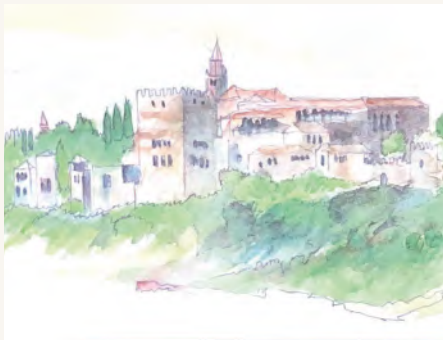
Alain Vivier, Alhambra, Grenade, Espagne, 2001