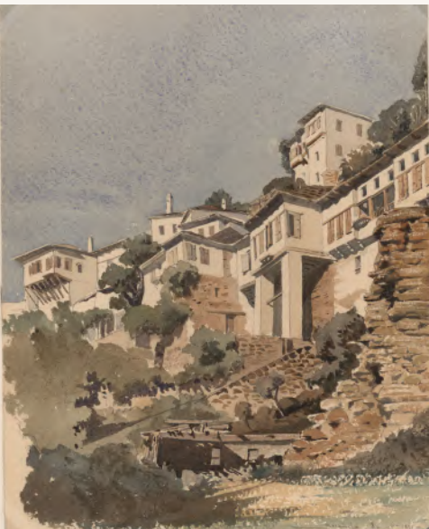
Alfred Normand, Voyage en Grèce, Péllon, 1851