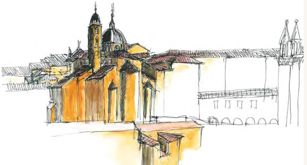
Serge Renaudie - Voyage en Italie, Urbino, 2005