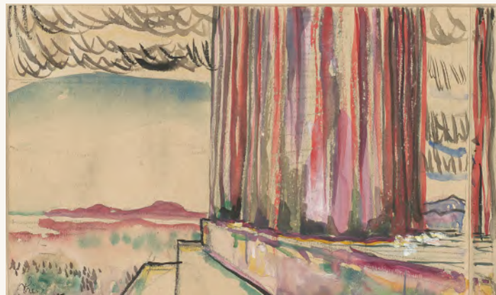
Ch.-E. Jeanneret, Acropole d'Athènes, le Parthénon, 1911

Les dix aquarelles présentées font partie d'une série intitulée par leur auteur Langage de pierres . Elles sont rassemblées en 1912, après son périple oriental, pour être présentées en diverses expositions en Suisse et au Salon d'Automne à Paris. Jeanneret y inclut deux aquarelles faites au moment d'un premier voyage hors la Suisse entrepris dans sa vingtième année, en septembre 1907, voyage d'études en Italie qui le mène en particulier dans les villes toscanes. L'une, représente la colline de Fiesole, vue depuis Florence, l'autre, la place du Campo à Sienne. Parmi celles exécutées en 1911, deux sont faites à Istanbul, trois sur l'Acropole d'Athènes, et une dernière sur le forum à Pompéi. Ces aquarelles sont représentatives de l'approche de coloriste du jeune Jeanneret (qui se voulait peintre durant ses années passées à l'École d'Art de La Chaux-de-Fonds) et elles témoignent de son attachement à saisir le potentiel poétique et pictural du lieu.