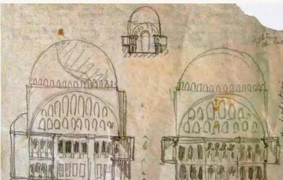
Ch E. Jeanneret, Istanbul, mosquée Nuruosmaniye, 1911

Il remplit alors, au jour le jour, nombre de carnets. Ceux retrouvés et publiés totalisent 914 feuillets, utilisés recto et verso, soit 1828 pages, crayonnées et annotées, auxquelles s'ajoutent quelque 200 pages détachées par leur auteur à l'occasion d'expositions ou de publications. Ces pages dévoilent les méthodes d'observation et de transcription du jeune voyageur. Les croquis saisissent, en quelques traits, l'essentiel de ce que son regard choisit de retenir : l'architecture dans son rapport au site, des profils de cités, des paysages urbains ; ou encore, l'articulation des volumes simples et la géométrie des formes, des rapports de proportions et des dimensions, des détails constructifs, des typologies d'habitat, des plans esquissant la distribution des espaces intérieurs, des principes d'arrivées de lumière ; les annotations donnent des informations sur la couleur, l'enduit, les matériaux ... Le futur architecte interroge ainsi l'histoire, les architectures - populaires et monumentales -, les villes (Istanbul, Athènes, Rome, Pompéi), les cultures découvertes au gré de ses pérégrinations.