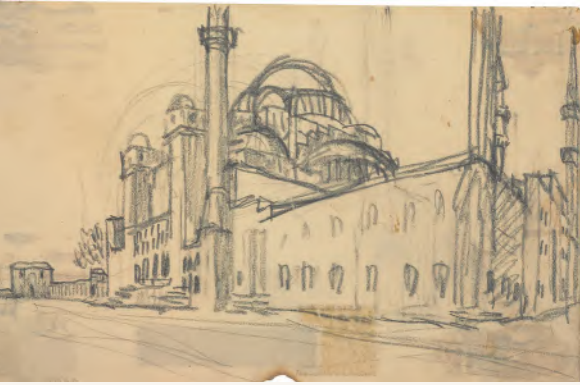
Ch E. Jeanneret, Istanbul, mosquée Süleymaniye, 1911