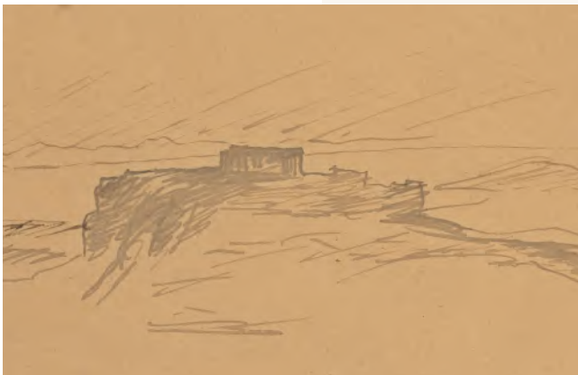
Ch E. Jeanneret, Athènes, l'Acropole vu du Lycabette, 1911

En mai 1911, Ch.E. Jeanneret, futur Le Corbusier, entreprend un long périple de six mois vers l'Orient traversant les Balkans, la Turquie, la Grèce pour parvenir au but espéré de l'Acropole et revenir par l'Italie : « Voir l'Acropole est un rêve qu'on caresse sans même songer à le réaliser. Je ne sais trop pourquoi cette colline recèle l'essence de la pensée artistique. Je sais mesurer la perfection de ses temples et reconnaître qu'ils ne sont nulle part ailleurs si extraordinaires ; et j'ai de longtemps accepté que ce soit ici comme le dépôt de l'étalon sacré, base de toute mensuration d'art. Pourquoi cette architecture et non une autre ? »