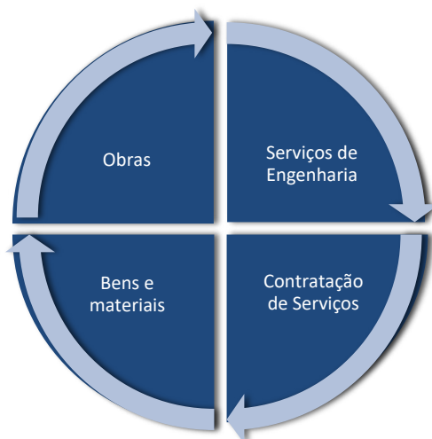
Figura 1 – Objetos permitidos para enfrentamento de calamidades

O objetivo principal da Medida Provisória nº 1.221/2024 é simplificar os procedimentos de contratações públicas dos órgãos e entidades das Administrações Públicas diretas, autárquicas e fundacionais da União, dos Estados, do Distrito Federal e dos Municípios, destinados ao enfrentamento de impactos decorrentes de estado de calamidade pública, garantindo segurança jurídica aos gestores e agilidade nos processos de contratação dos seguintes objetos: