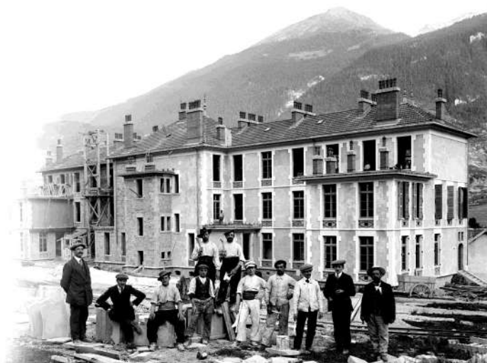
Ouvriers italiens sur le chantier de construction de la caserne et de l'hôpital militaire à Modane.